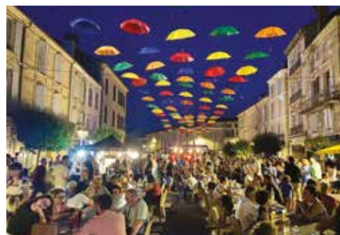
La fête de la musique