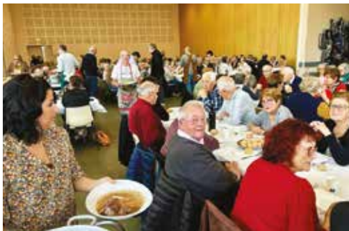
Le repas des aînés