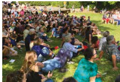
Le festival La P'tite Garenne