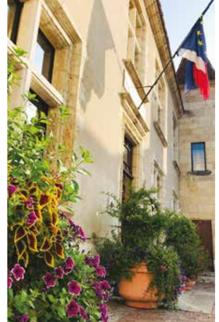
Le mairie fleurie