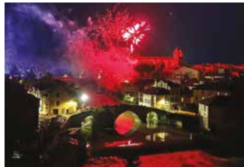
Le feu d'artifice sur la Baise