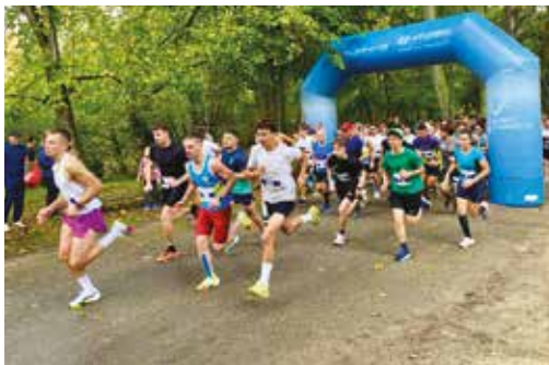
Les Foulées d'Henri IV