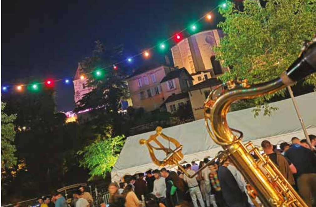
Les fêtes de Nérac