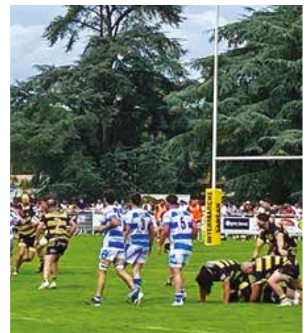
Le stade André Duprat