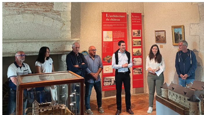
Inauguration du parcours Jeunesse au Château-musée Henri IV, 3 juin 2025