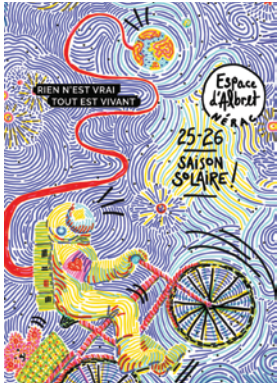
Le livret de présentation de la saison culturelle 2025 / 2026

Elle se veut accessible à tous et tisse des chemins à la rencontre de ses publics, de son territoire et de ses habitants.