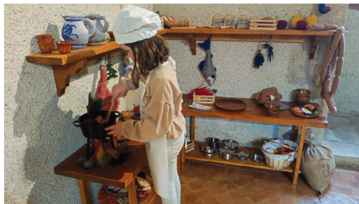
Reconstitution miniature d'une cuisine de la Renaissance