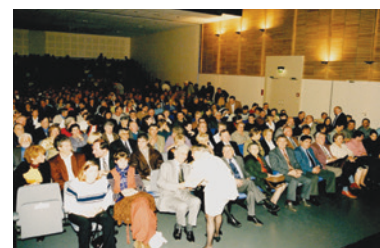
Soirée d'inauguration, salle de spectacles