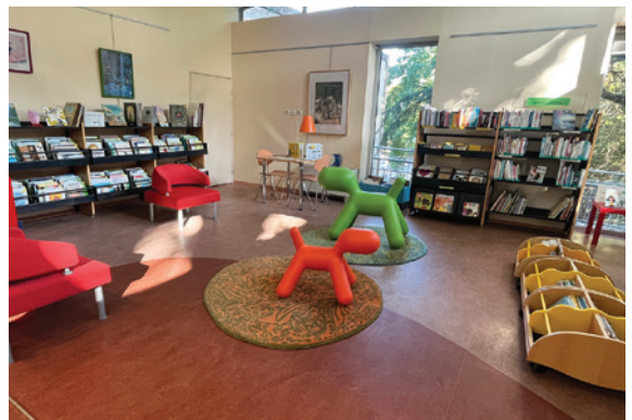
Médiathèque Yves Chaland, espace jeunesse