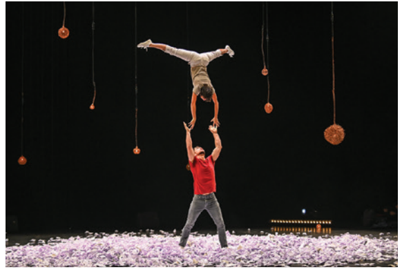
Spectacle de cirque, Cie Ziguilé

Ouverte aux particuliers et à la vie associative locale.