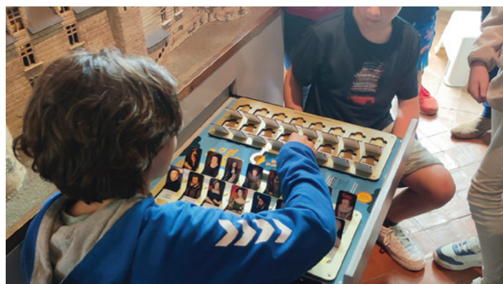
Les enfants testent le jeu "Qui est-ce royal !"