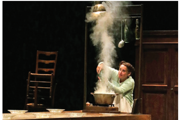
Spectacle de théâtre, Cie Hecho en Casa