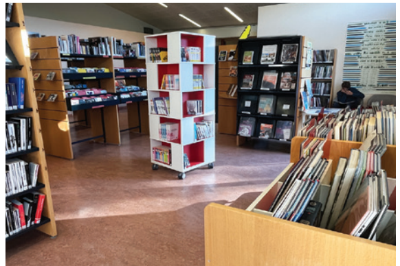
Médiathèque Yves Chaland, espace adultes