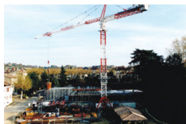
Travaux de construction, 1999