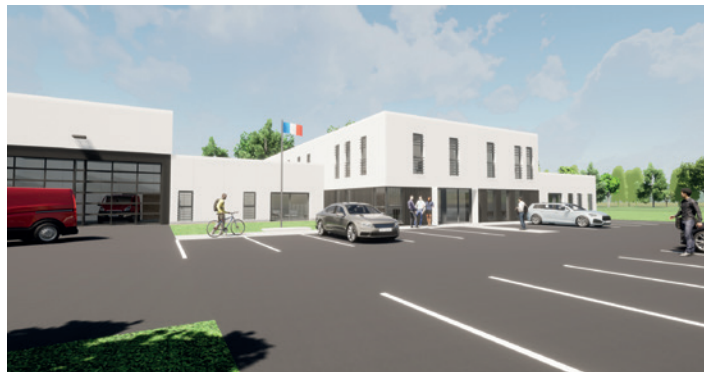
Le projet de la future caserne