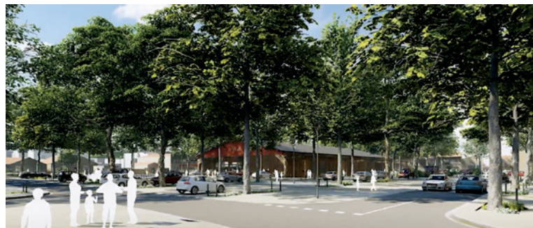
Le projet d'aménagement de la place du Foirail