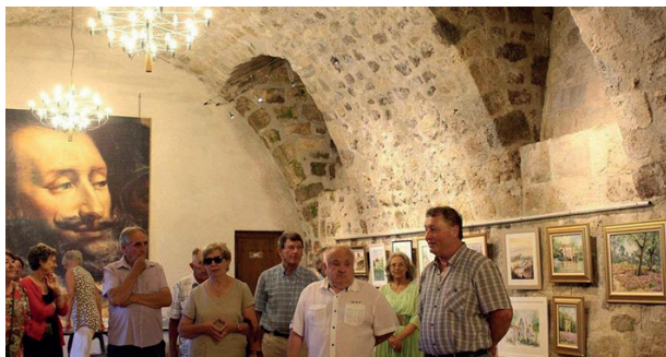
La salle des Écuers

Le montant total des travaux s'élève à 1 871 167 € (835 570 € de subventions attendues).