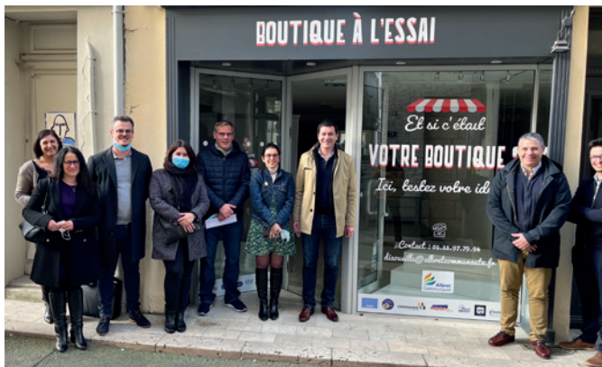
Présentation du dispositif Boutique à l'essai aux partenaires.

La Mairie de Nérac adhère au dispositif « Boutique à l'essai ». L'objectif est de proposer à un porteur de projet de tester son idée de commerce . L'originalité du dispositif réside dans le fait qu'aucun argent public n'est dépensé. Le rôle de la collectivité consiste à fédérer des partenaires privés et publics ainsi qu'un bailleur afin de créer les conditions de la réussite pour les porteurs de projets.