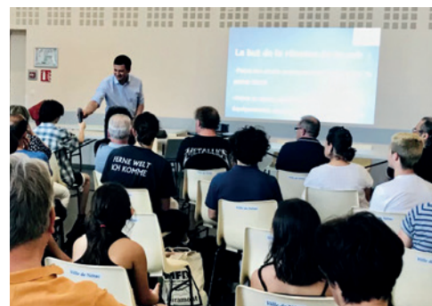
Réunion de concertation avec les futurs usagers sur les équipements de plein air le 17 mai.

Le montant total de ces équipements s'élève à 405 000 €, subventionnés à 80% par l'État et l'Europe.