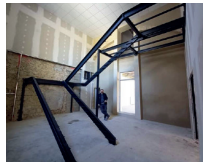
Travaux au centre Samazeuilh