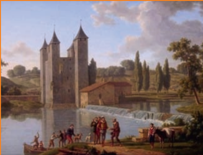
Millin du Perreux, Moulin de Barbaste, Musée National du Château de Pau.