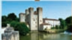
Moulin des Tours 1h de visite