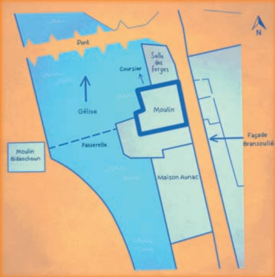
Plan du site du Moulin des Tours