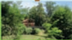
Parc de la Garenne 1h de visite